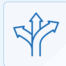
Missions de développement export