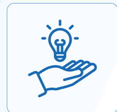
Accompagnement & transfert de compétences